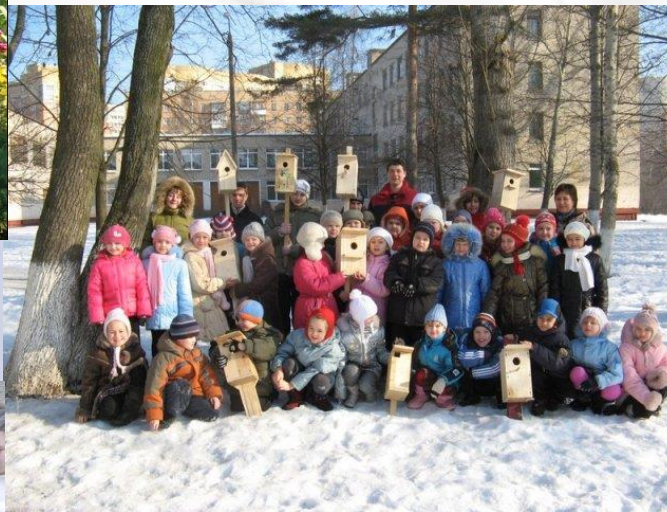
Школа №1 г.Пушкино. Экологический отряд