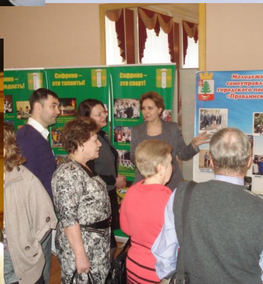
Выставка молодежного самоуправления Пушкинского муниципального района