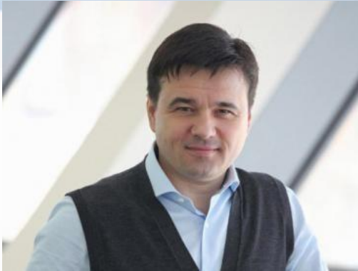
ВОРОБЬЁВ Андрей Юрьевич, Председатель Правительства Московской области