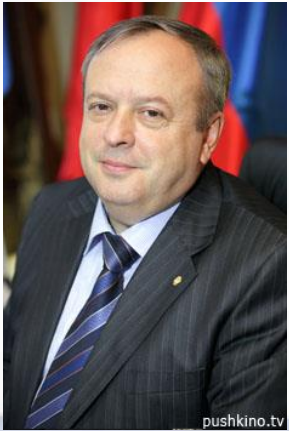
КУЗЬМЕНКОВ Андрей Иванович, Глава г.п.Правдинский