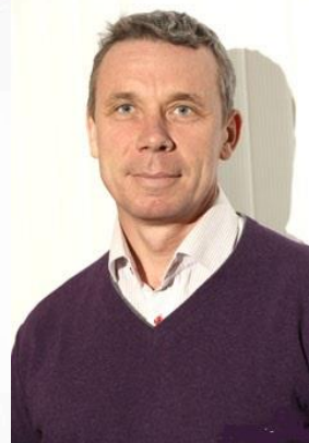
ТРОПИН Александр Вениаминович, Глава г.п.Лесной