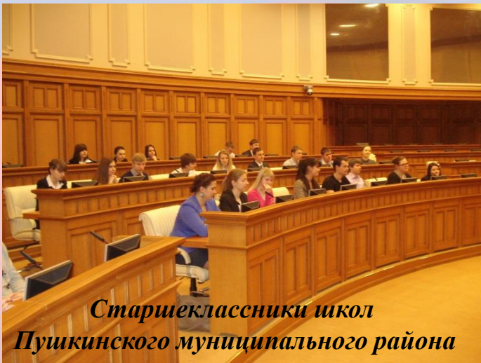
Старшеклассники школ Пушкинского муниципального района