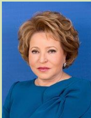
Матвиенко Валентина Ивановна, председатель Совета Федерации