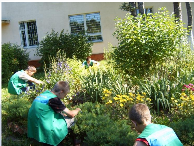
Школа №2 п.Софрино