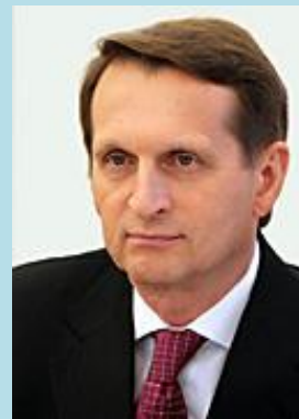
Нарышкин Сергей Евгеньевич, председатель Государственной Думы