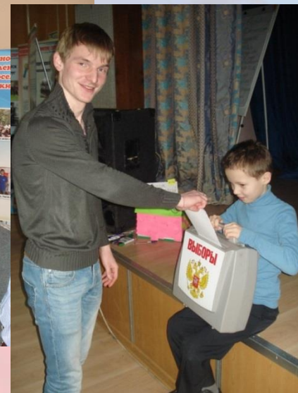
Выборы лидера в Лагере Молодежного актива