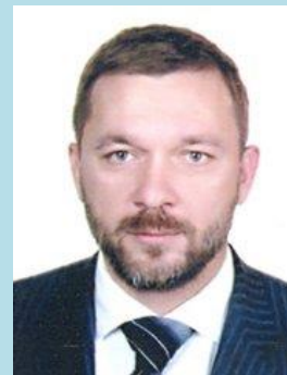
САБЛИН Дмитрий Вадимович, член Совета Федерации