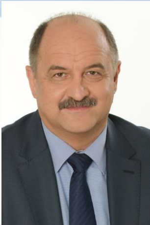
ГУЛИН Сергей Иванович, Глава города Пушкино