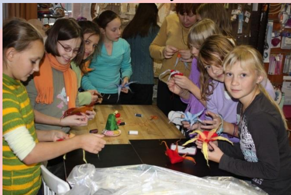
Гимназия №10 г.Пушкино