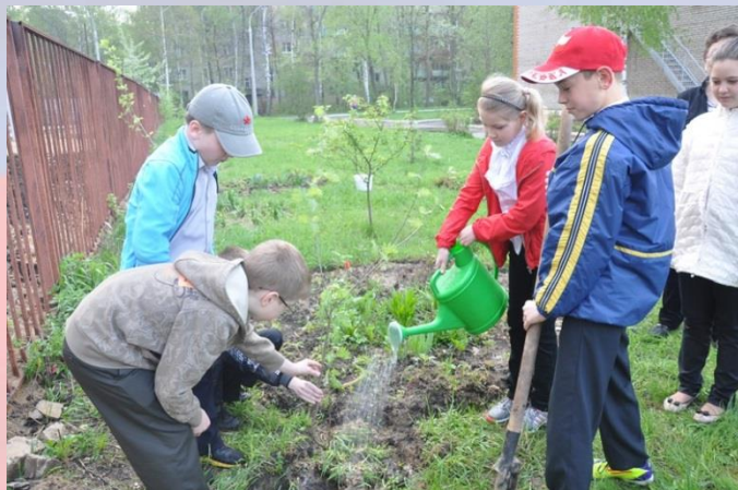
Школа №8 г.Пушкино, посадка деревьев