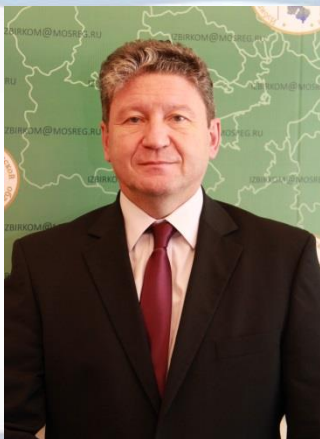
ВИЛЬДАНОВ Ирек Раисович, Председатель Избирательной комиссии Московской области