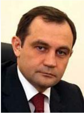
БРЫНЦАЛОВ Игорь Юрьевич, Председатель Думы V созыва