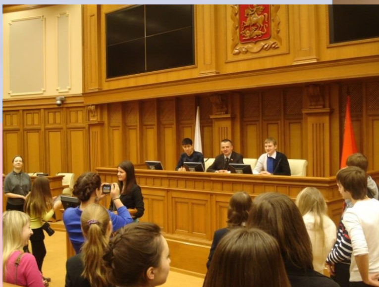
Экскурсия в Московскую областную Думу