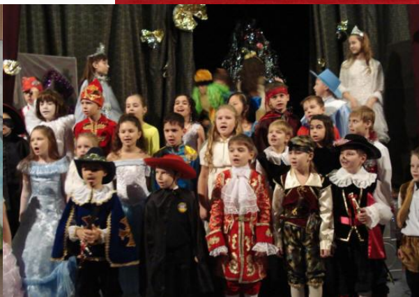
СОШ №5 г.Пушкино