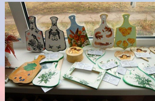
СОШ №1 г.Пушкино