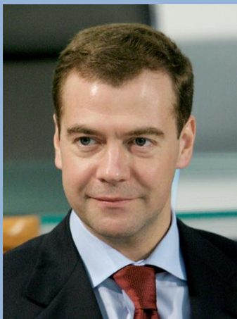
МЕДВЕДЕВ Дмитрий Анатольевич, Председатель Правительства РФ