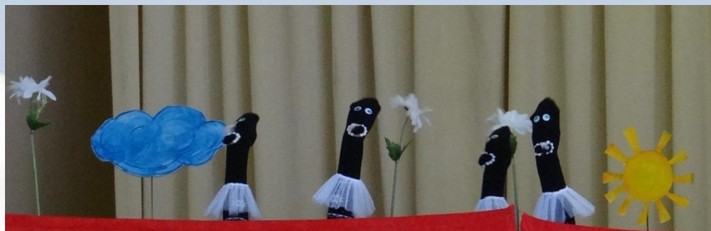
СОШ №6 г.Пушкино