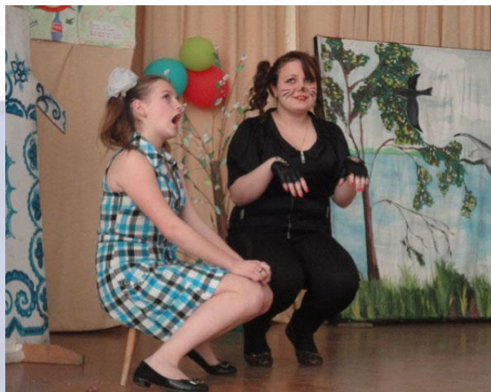
СОШ №9 г.Пушкино