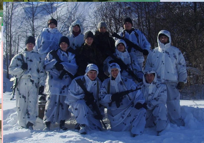
Военно-спортивный Патриотический Клуб «Патриот - ВДВ» СОШ №6 г.Пушкино