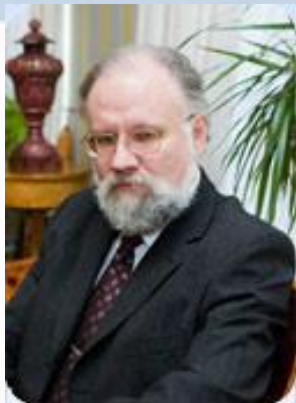
ЧУРОВ Владимир Евгеньевич, Председатель Центральной избирательной комиссии Российской Федерации