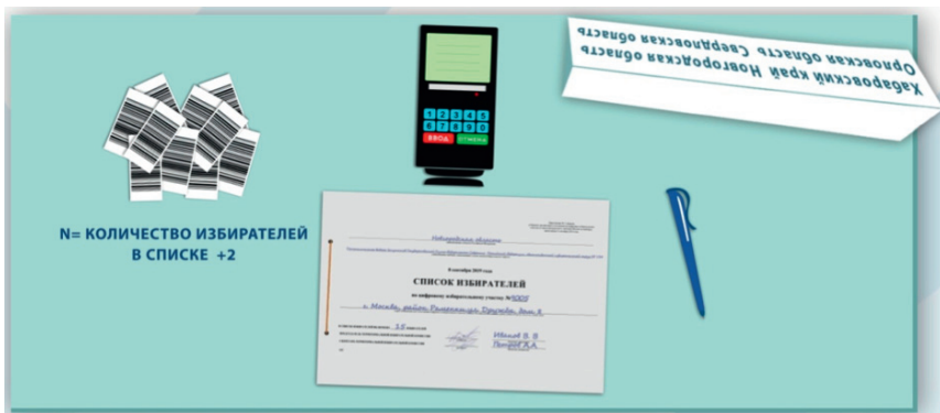
Рабочее место члена УИК ЦИУ

При предъявлении паспорта гражданина Российской Федерации член УИК проверяет наличие избирателя в списке избирателей данного участка на соответствующих выборах.