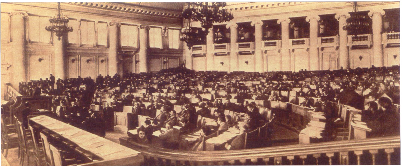
Заседание Государственной думы