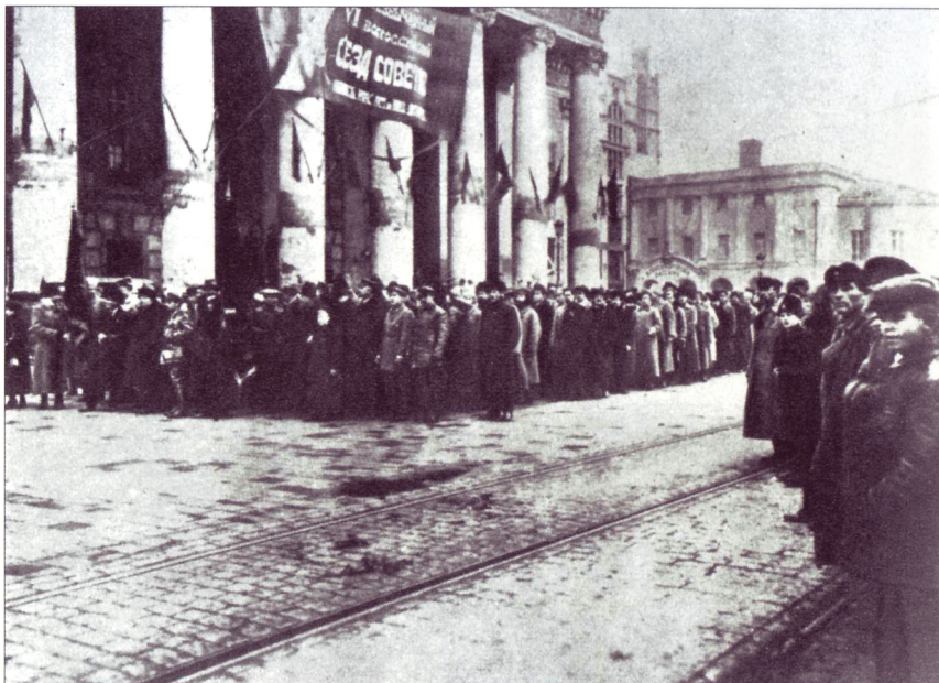
Делегаты VI Чрезвычайного Всероссийского съезда Советов. 1918 г.