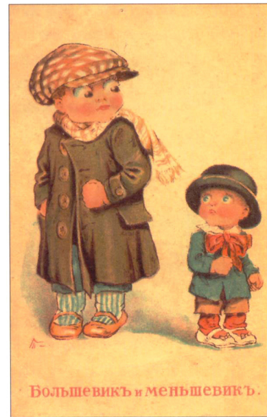
Большевик и меньшевик