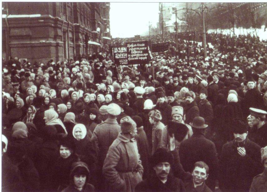
Демонстрация с требованием созыва Учредительного собрания на Красной площади в Москве