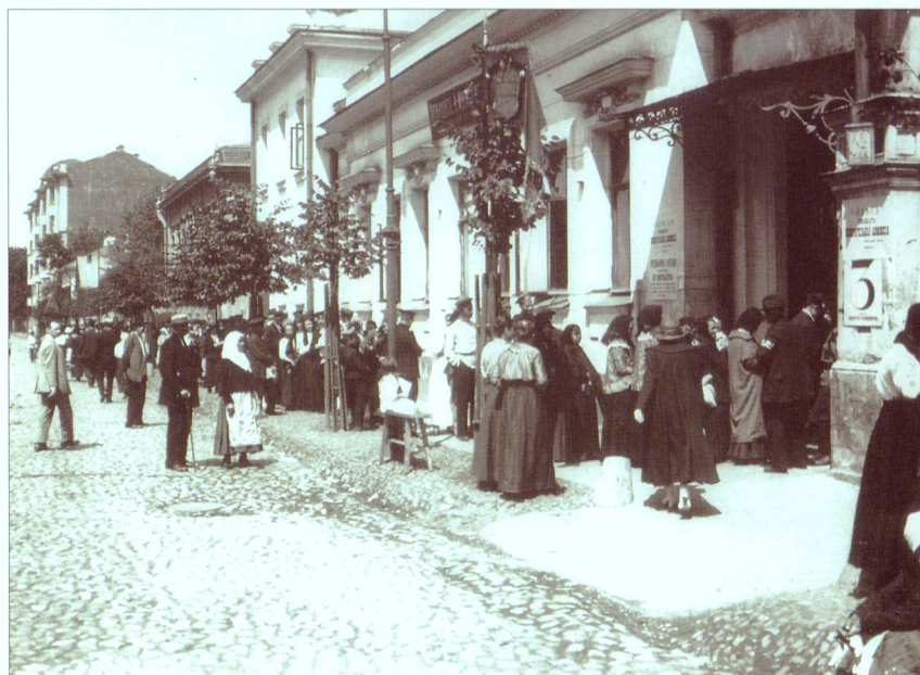
Городские выборы в Москве. Лето 1917 г.