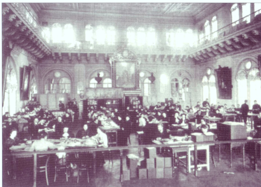
Выборы в Государственную думу. Подсчет голосов