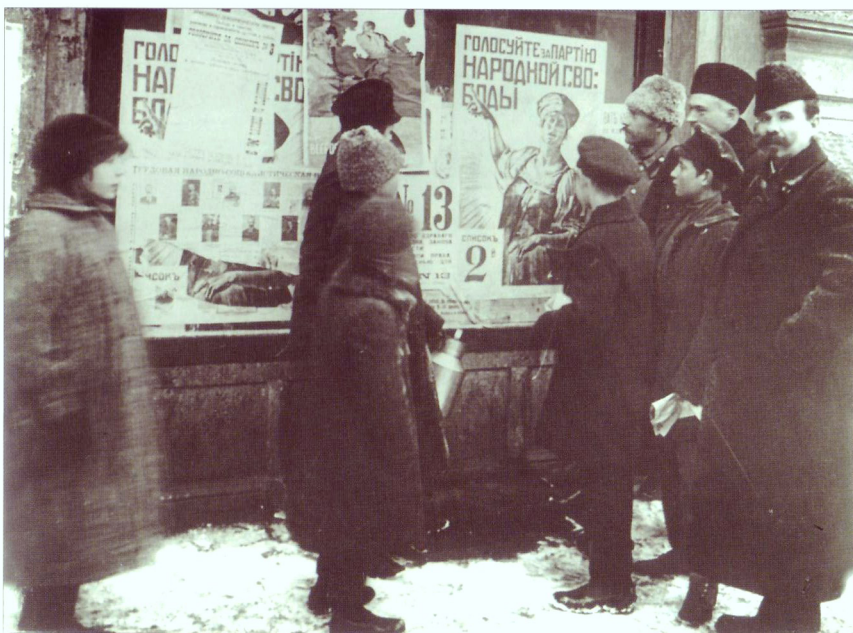
Плакаты со списками по выборам в Учредительное собрание