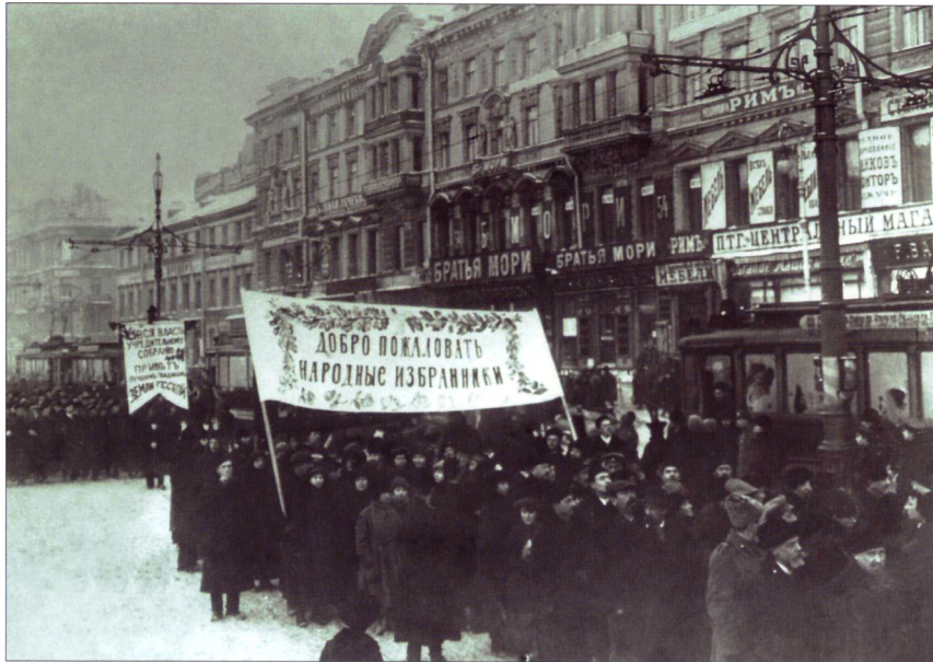
Демонстрация в день открытия Учредительного собрания 5(18) января 1918 г.