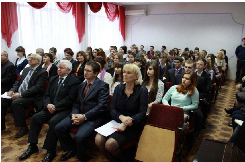
Участники и организаторы олимпиады