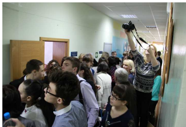
Предварительные результаты олимпиады размещены на стенде