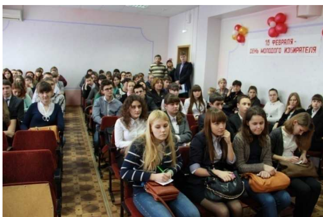
Участники олимпиады в ожидании результатов