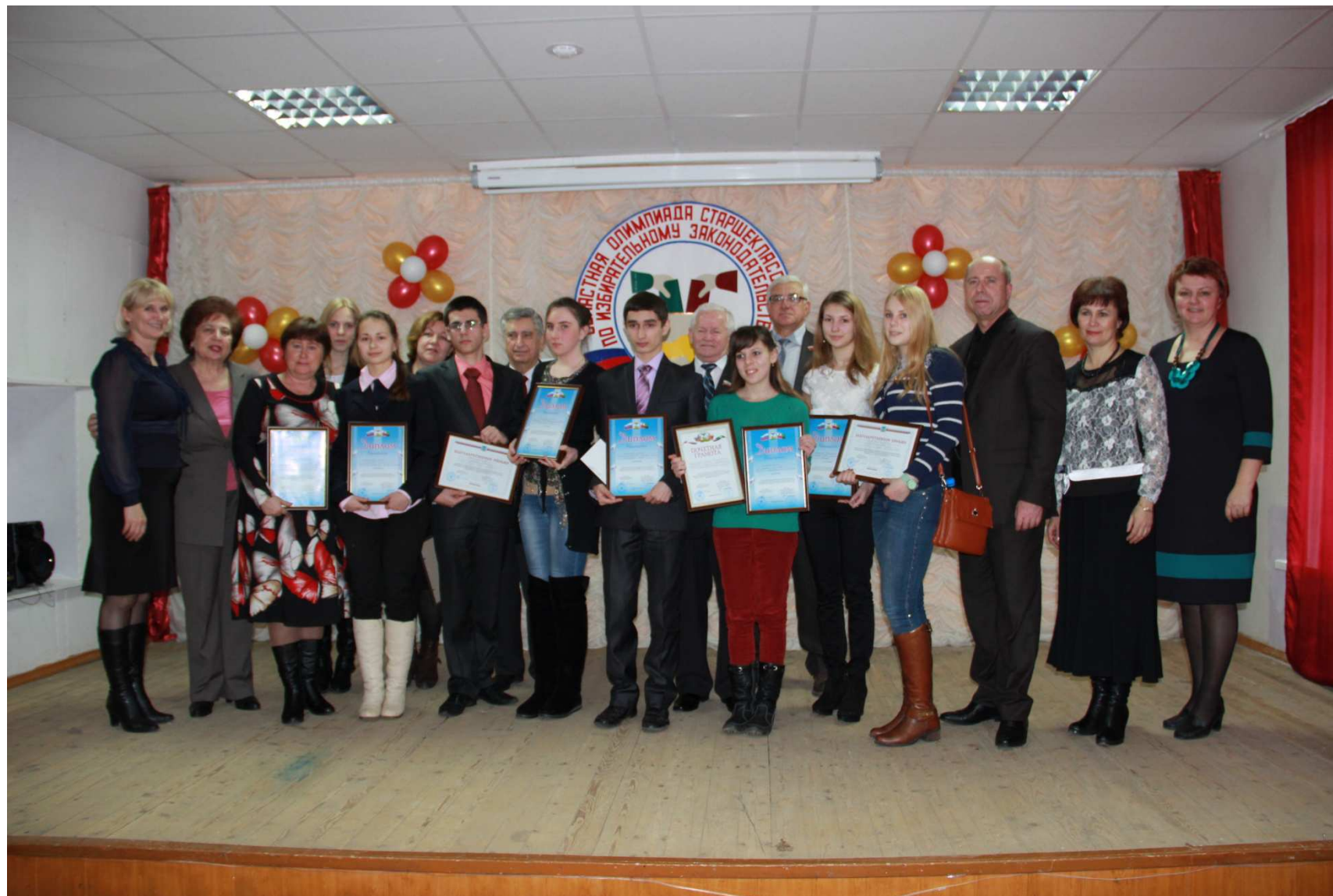
Победители и призеры олимпиады