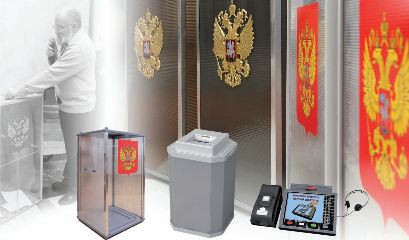
Стационарный ящик для голосования