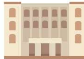
Общественная палата субъекта РФ

Не позднее чем за 3 дня до дня (первого дня) голосования (досрочного голосования)