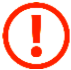
Схема одномандатных и (или) многомандатных избирательных округов определяется избирательной комиссией, организующей выборы, на основании данных о численности избирателей

Депутаты представительного органа утверждают схему избирательных округов не позднее чем за 20 дней до истечения срока, на который была утверждена прежняя схема