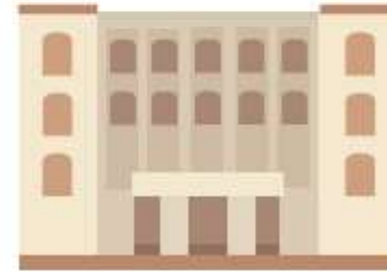
Общественная палата субъекта РФ

Не позднее чем за 7 дня до дня (первого дня) голосования (досрочного голосования)