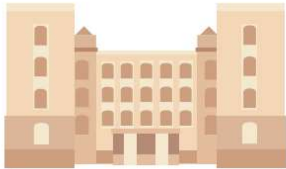
Общественная палата РФ

указанными в пунктах 1 и 2 части 1 статьи 9 Федерального закона от 21 июля 2014 года № 212-ФЗ «Об основах общественного контроля в Российской Федерации»