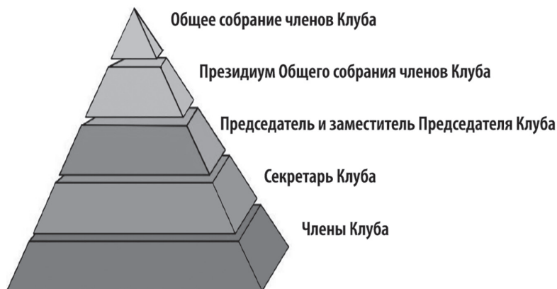
Рис. 1. Сложная организационная структура управления КМИ

Структура КМИ может быть совершенно разнообразной. Самый простой тип системы управления – это несколько членов и председатель клуба. Но бывают и сложные организационные структуры внутри клубов (рис. 1).